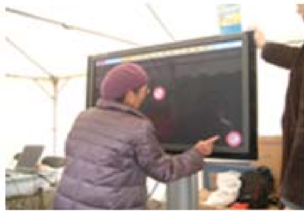
周辺視基礎トレーニング

■ 「UBI-Comタッチディスプレイ」は、「認知力訓練プログラム」の推奨ツールです。